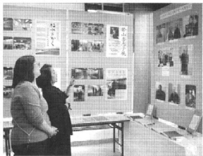
右側の写真は林師と厚情のあった人達のポートレート、 正面は企画展関係の資料＝千本郷林の牧水記念館で

樹回顧展」。 同展では、林師の 生涯からの歩みが年 表で示され、牧水の 顕彰だけでなく、宗 門、公職、教育関係 など各分野にわたっ て幅広く足跡を残し た様子をつうかがい 知ることができると している。