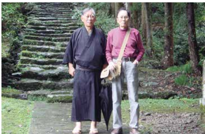
林茂樹前理事長と筆者(平成22年)